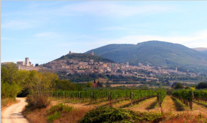
Blick auf Assisi

Auf dem Weg begegnet ihnen Jesus. Lebendiges Erinnern. Es wird wesentlich. Der Kern der Botschaft. „ Brannte uns nicht das Herz in der Brust, als er unterwegs mit uns redete und uns den Sinn der Schrift erschloss? “ (Lukas 24): in diesem Sinne wollen wir uns miteinander auf den Weg machen.